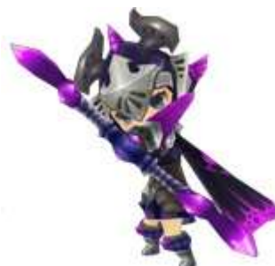
アーチャー 天眞翼竜