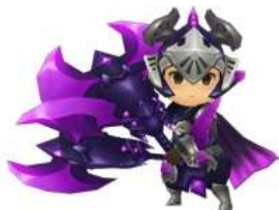
ウォーリア 天臨翼竜