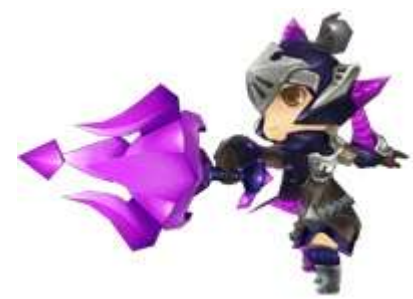
ウィザード 星巡翼竜

※プレイする難易度(level1~10)によって獲得できる報酬のレアリティ、装備部位は異なります。