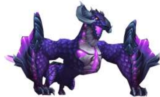
レイドボス「ワイバーン」