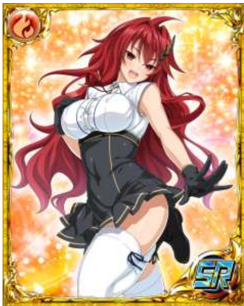
SR[はつらつ]如月刹那