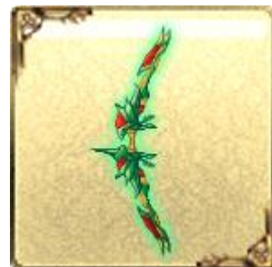
「UR」トネリコスナイパー