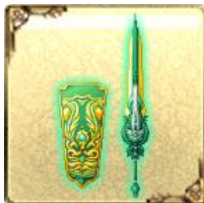
「UR」トネリコガーディアン