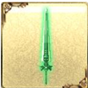
「UR」トネリコインパルス