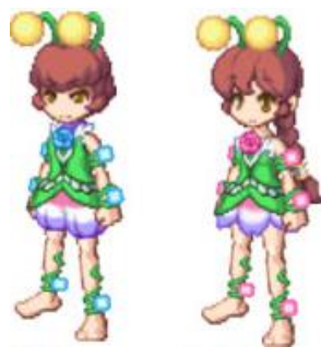
「限定」妖精アバター

昨年に開催した「ぬし釣り」が、さらにパワーアップして帰ってきました！今回の舞台はエルネの森。川のそばにある「釣竿」を選択し、幻の魚「ぬし」を釣り上げ、倒すことで「ぬしの金鱗」をGET出来ます。「ぬしの金鱗」は、SR 武器ガチャ券や進化の秘石、限定アバターなどと交換可能！たくさん集めて豪華アイテムをゲットしよう！