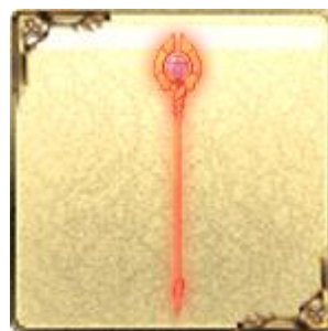
「UR」ダリアサーヴァント