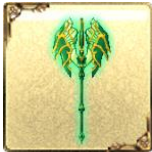
「UR」トネリコティアーズ