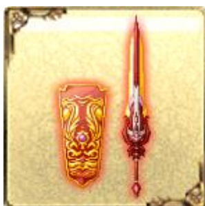
「UR」ダリアガーディアン