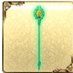
「UR」トネリコサーヴァント