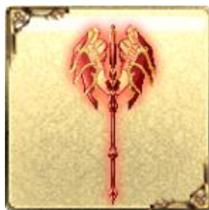
「UR」ダリアティアーズ