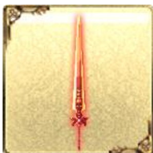
「UR」ダリアインパルス