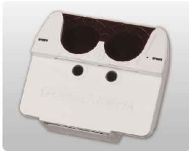
●トレッタスキャナー・1個