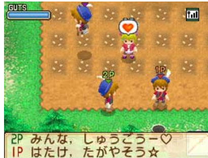
※画面は開発中のものです（通信プレイ時）