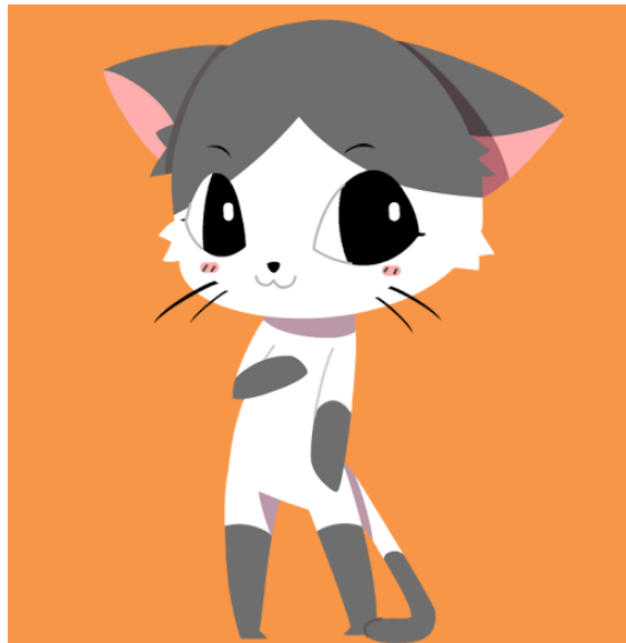
mixi 限定動物「エイミー」